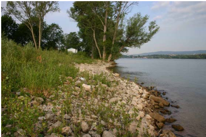
Vorher, Juni-2004: Bauschuttreste bestimmen das Bild.

Nach Aufgabe der Nutzung musste das Gebäude abgerissen und das Ufer in den ursprünglichen Zustand versetzt werden.