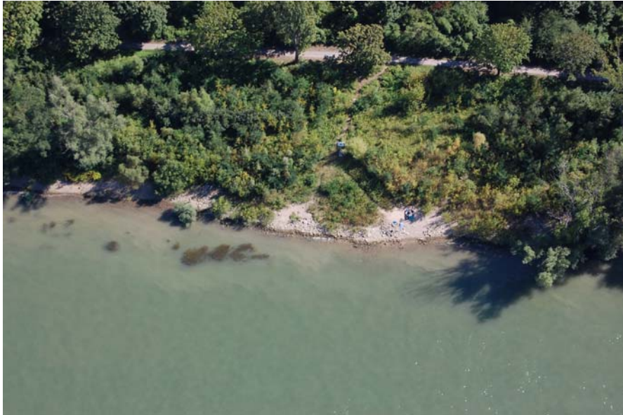
Naturnahe Ufersituation in Budenheim mit Freihaltung Sichtzeichen (Befliegung 15.08.2010)