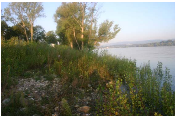
Nachher, Oktober 2006: beginnende Auwaldentwicklung.

Nachher - Allmähliche Auflandung von Treibgut und kiesig-sandigen Sedimenten des Rheins bildet die Basis für eine naturnahe Auwaldentwicklung.