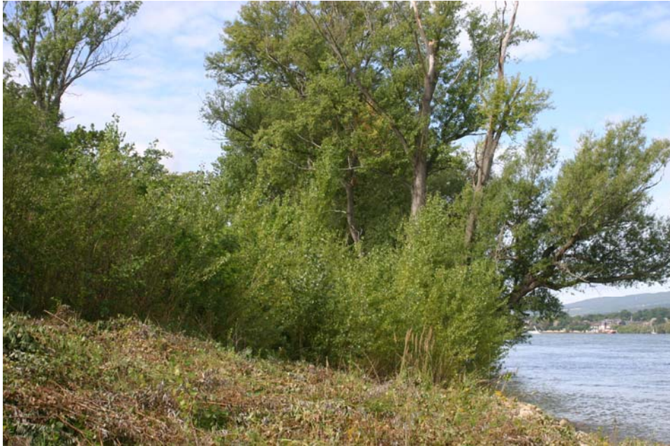
Nachher, September 2010: fortgeschrittene Auenwaldentwicklung.