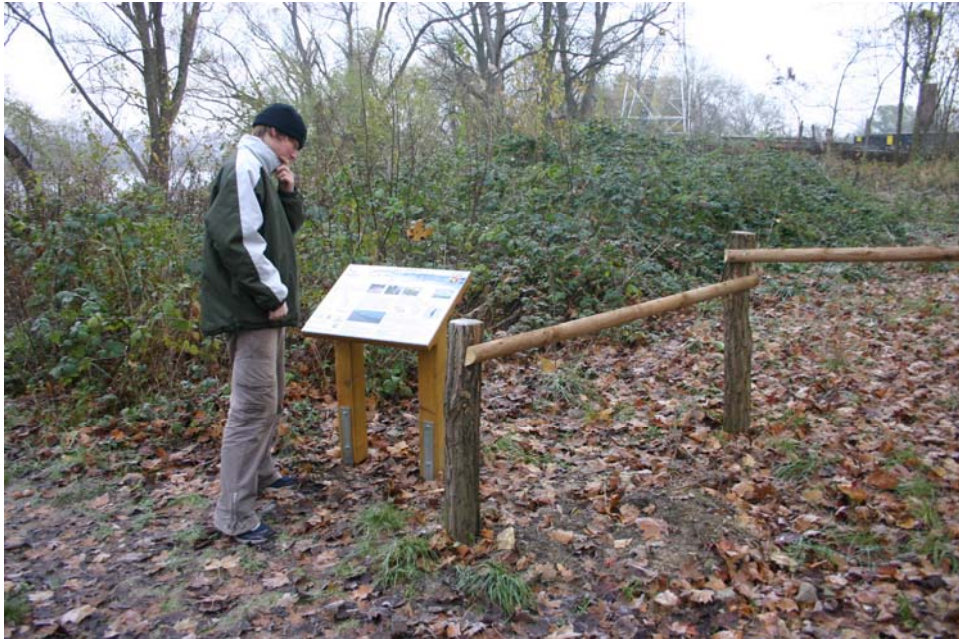
Besucherlenkung und Information am Ufer Budenheim

Die Unterhaltung im Vorfeld von neu errichteten Hektometerschildern verhindert allerdings eine natürliche Sukzession.